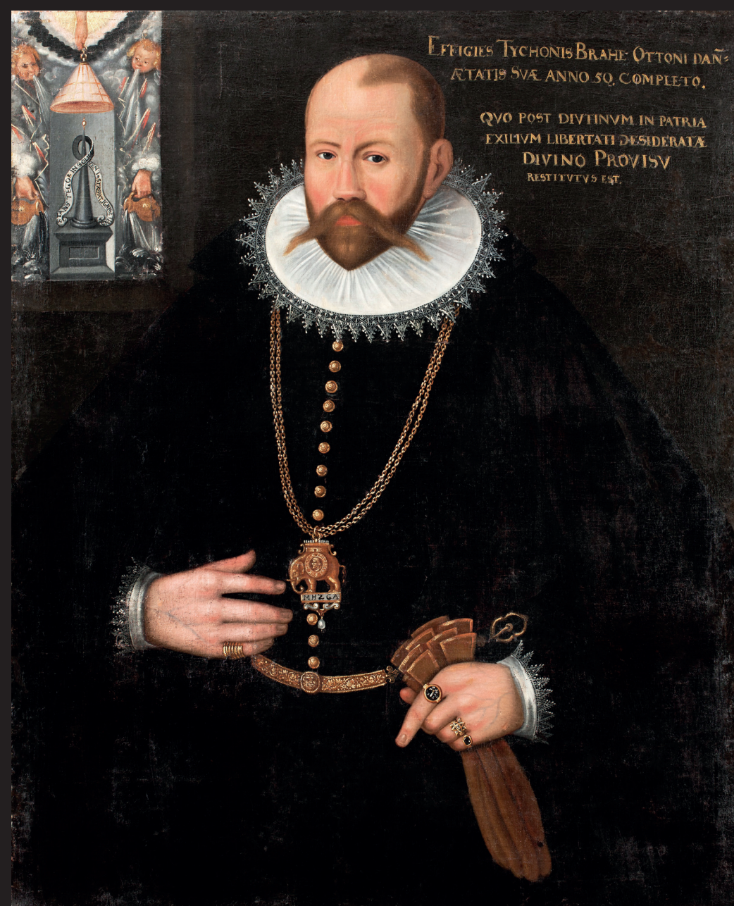
Portrait de Tycho Brahé, 1596, Suède, Château de Skokloster

L'astronome danois Tycho Brahé (1546-1601) observe en 1572 un phénomène rarissime : l'explosion d'une supernova.