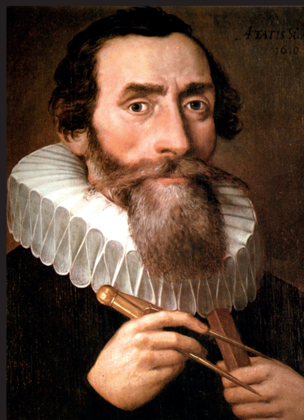
Portrait de Johannes Kepler, 1610